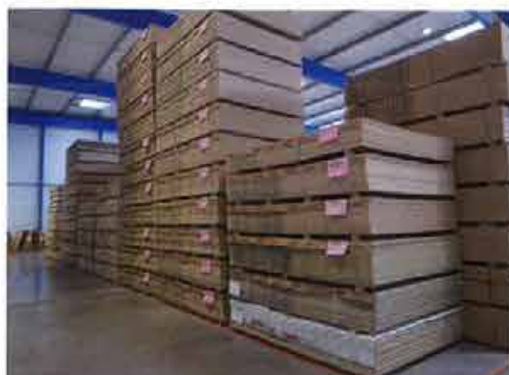
Adhérent Sylvalliance, Bailly Quaireau peut réaliser des achats en gros volumes et les entreposer sans problème. Ici un lot de panneaux Egger.