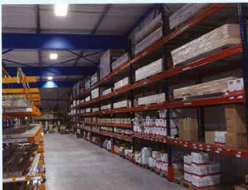
Un stock de 800 m 2 permet de répondre aux demandes d'enlèvements de marchandises et achats effectués sur place.