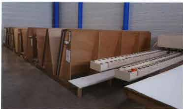
Les feuilles de stratifiés sont stockées sur racks pour les grandes quantités et en portefeuille pour les petites quantités. Visible sur le côté, une machine à enrouler les feuilles de stratifiés.

Lors de la préparation de commande, le système connaît précisément l'emplacement de chaque panneau et effectue les déplacements nécessaires pour les atteindre et les amener sur le convoyeur ; une préparation a lieu en amont pour optimiser l'ordre des préparations de commandes afin d'optimiser les mouvements. Les lots sont ensuite transportés par chariot élévateur dans des racks proches du hall d'expédition avant leur transfert dans les camions.