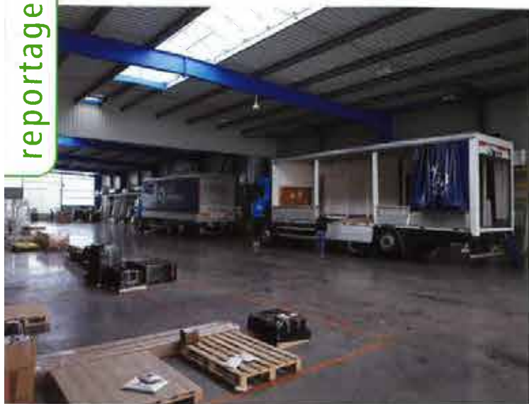
Le hall central de 2 000 m 2 offre un grand espace de travail sécurisé pour la réception et l'expédition des marchandises.