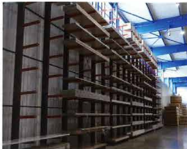
Avec une surface de 3 500 m 2 dédiée aux produits bois, Bailly Quaireau a pu élargir sa gamme avec des plaques en PVC et plexiglas, et visibles sur la photo des plans de travail stratifiés de la marque Duropal. L'entreprise va étoffer son référencement en mélaminés et en essences fines.

l'objectif d'avoir réalisé tous les chargements avant 8h. A terme, quand le volume de marchandise à expédier sera plus important, l'entreprise entend faire réaliser de nuit la préparation de ses commandes de panneaux pour des expéditions programmées plus tôt le matin.