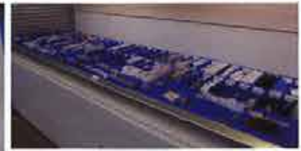
Trois Kardex de 9 m de haut permettent de stocker jusqu'à 7 500 références de produits de quincaillerie.

préparation des commandes, un picking bas de proximité est aménagé pour les très grosses rotations. Une fois les commandes préparées, elles sont transférées par des chemins de roulement vers la zone de liaison pour être