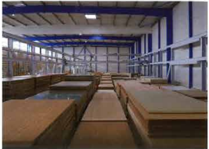
Le transstockeur de panneaux installé sur 60 x 16 m chez Bailly Quaireau peut accueillir jusqu'à 11 000 pièces et sera bientôt paramétré pour préparer cinq commandes de rang. Il lui faut environ 1 minute 30 pour sortir un panneau.