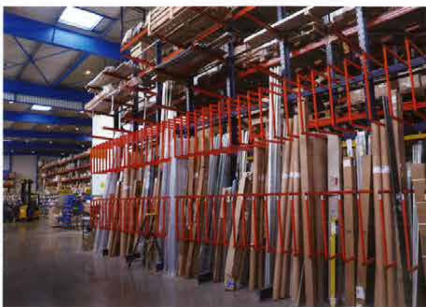
La plus grande partie du bâtiment dédié au stockage des produits manufacturés est occupé par des racks culminant à 9 m de hauteur, dont certains sont conçus pour accueillir des éléments de grandes longueurs.